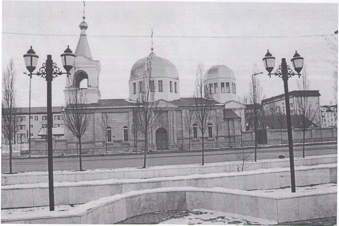
Фото 1 Объект культурного наследия регионального значения «Церковь Архангела Михаила» г. Грозный, Ленинский район, пр. А.А. Кадырова, д.21