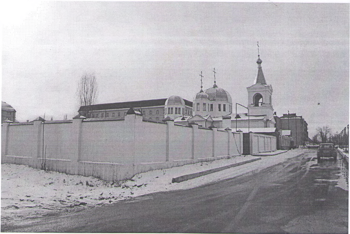
Фото 2. Объект культурного наследия регионального значения «Церковь Архангела Михаила» г. Грозный, Ленинский район, пр. А.А. Кадырова, д.21