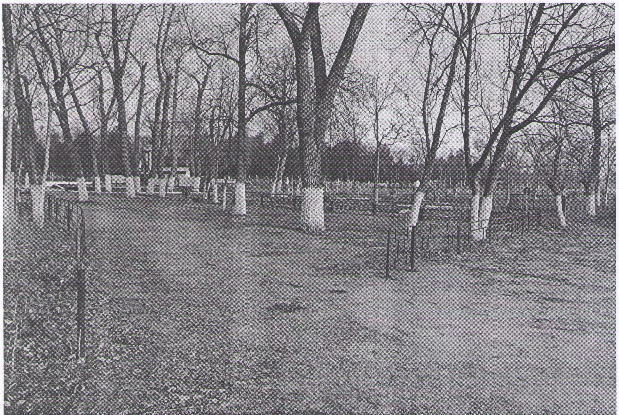
Фото 2. «Братская могила советских воинов, погибших в боях с фашистами на подступах к г. Грозный и умерших от ран в госпиталях в 1942-1945 гг.». г. Грозный, Ленинский район, городское кладбище.