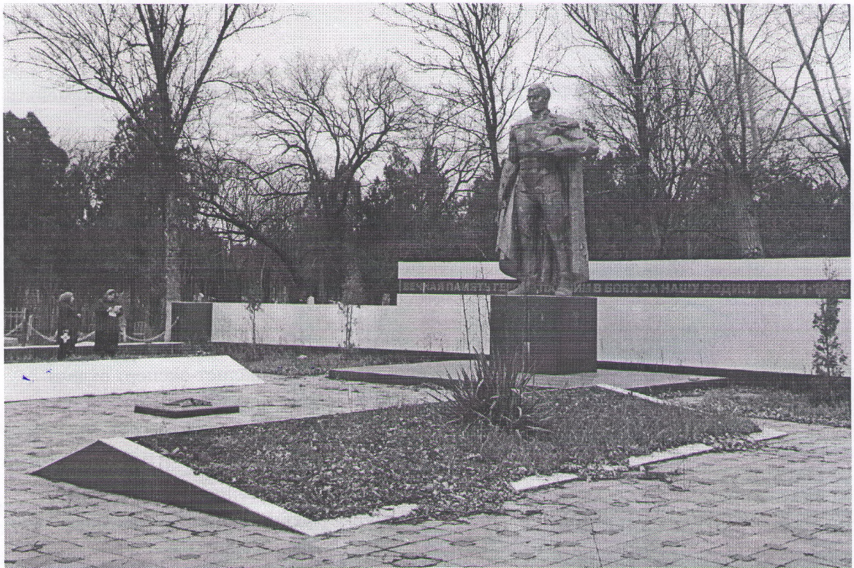
Фото 1. «Братская могила советских воинов, погибших в боях с фашистами на подступах к г. Грозный и умерших от ран в госпиталях в 1942-1945 гг.». г. Грозный, Ленинский район, городское кладбище.