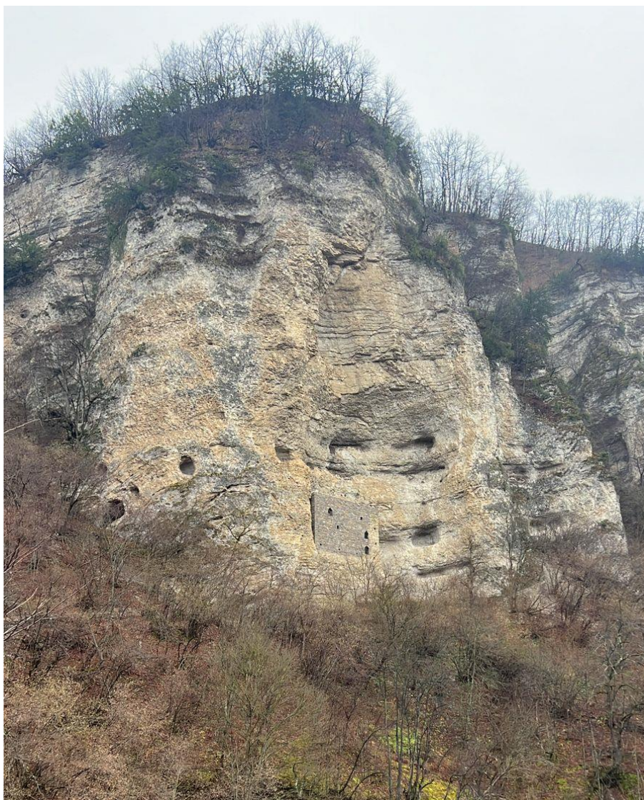
Объект культурного наследия регионального значения «Башня-убежище (сторожевая)» (Чеченская Республика, Шатойский район, с. Нихалой). Северный фасад. Декабрь 2023 г.